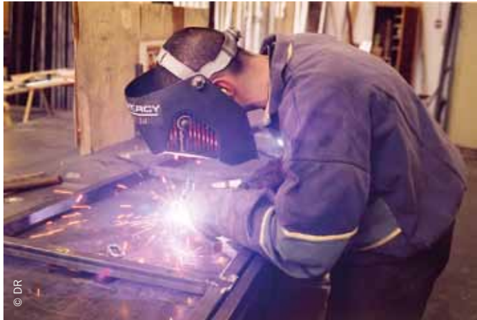
Atelier de construction de décors (serrurerie)