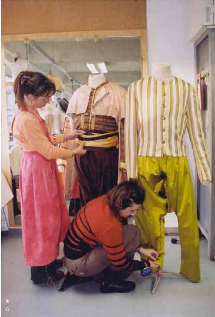
Atelier de fabrication de costumes