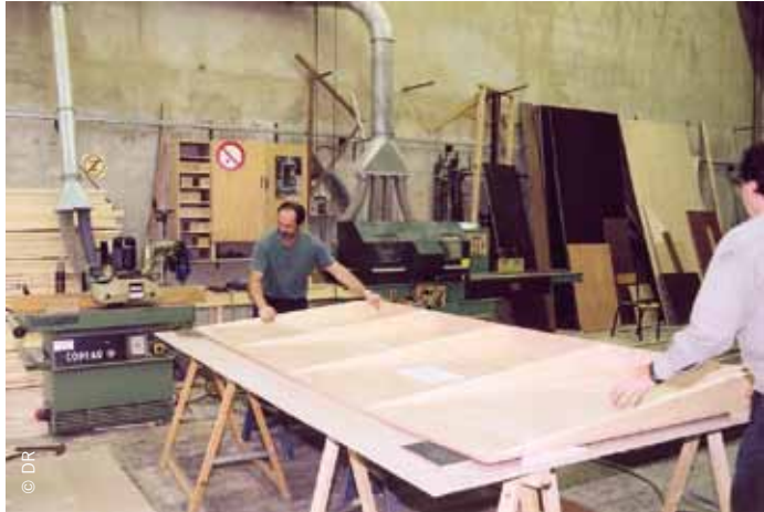
Atelier de construction de décors (menuiserie)