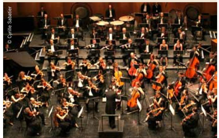
Orchestre Symphonique Saint-Étienne Loire